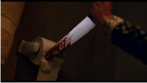
Abb. 20: Anthony Perkins: Psycho III (1986), 63. Minute.