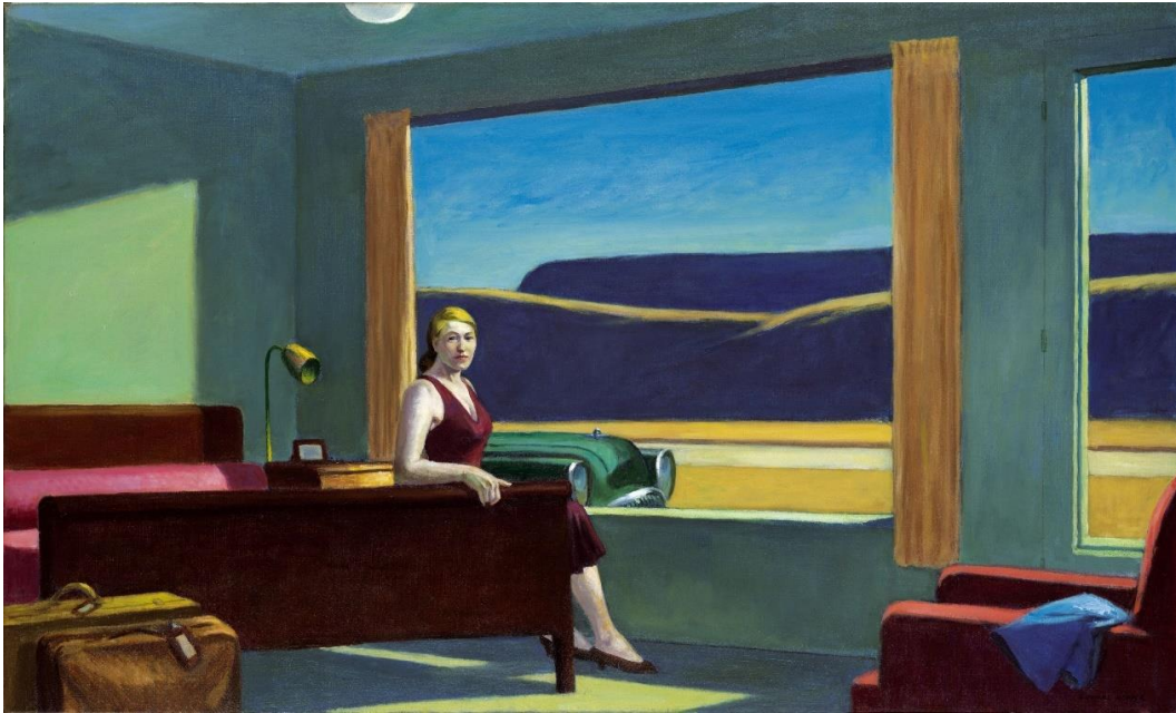
Abb. 6: Edward Hopper: Western Motel (1957)

Das gilt vor allem für die Interieurs der neuen modernen Gasthäuser, den hotels und motels , die im 20. Jahrhundert wie Pilze aus dem Boden sprießen und der Hypermobilität ihrer Zeit Rechnung tragen. In Hoppers Western Motel (1957) spitzt sich sein Hang zu klaren starken Kontrasten und geometrischen Formen, die nicht vor den Kultureinrichtungen halt machen und sich auch außerhalb der Räume in der Wüste vor dem Fenster fortsetzen, deutlich zu. Keinesfalls behaglich wirken die kalten Oberflächen des harten Bettes, der nackten grellen Wände und der vollkommen kahlen Einrichtung dieses modernen Raums, in dem man sich nicht länger als nötig aufhalten möchte. Aller Sterilität des Bildaufbaus zum Trotz entsteht eine Unruhe, wie es sie nur an einem Nicht-Ort gibt: Ist die allein reisende Dame eben erst angekommen oder schon wieder rastlos auf dem Sprung? Blickt sie gespannt in die Richtung, von wo sich jemand nähert, oder fühlt sie sich einfach nur von uns beobachtet? Und was bloß verbirgt sich im großen Koffer und wohin nur wird das grüne Auto, das im Fenster hervorguckt, die mysteriöse Dame noch führen?