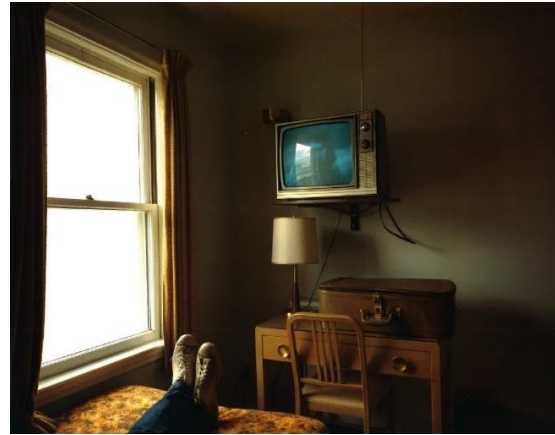
Abb. 14: Stephen Shore: Uncommon Places: Room 30, Sun N' Sand Motel, Holbrook, Arizona, August 10, 1973. Abb. 15: Stephen Shore: Uncommon Places: Room 125, Westbank Hotel, Idaho Falls, Idaho, July 18, 1973.