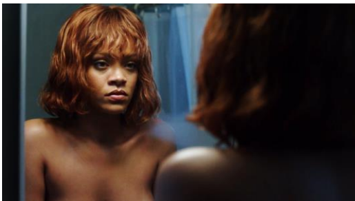
Abb. 30: Bates Motel (Staffel 5, Folge 6): Marion (2017), 20. Minute.

Was den notwendigen Vorrat an Duschvorhängen betrifft hat Norman unverhofftes Glück, das sich natürlich gegen ihn wenden wird: Im kürzlich eröffneten lokalen Haushaltswarengeschäft (der eigentlich im Zeitalter des Online-Handels ein Nostalgieladen ist) freut sich stets die Inhaberin Madeleine Loomis – die verdächtig nach einer jungen Version von Norma aussieht und zudem den Nachnamen von Marions Liebhaber Sam von 1960 trägt – auf den regelmäßigen sowie verlässlichen Abnehmer von Duschvorhängen („they do not really last to long“, Abb. 29), in dem sie schnell einen Freund für einsame Stunden findet. Während der Nachschub an shower curtains also nicht abreißt, mietet sich Sam Loomis – Madeleines viel reisender erfolgreicher Ehemann – mit seiner Affäre im Bates Motel unter dem Decknamen „David Davidson“ ein (Norman rechnet die ganze Nacht zum nicht rabattierten Tarif ab, obwohl die beiden natürlich nur einige Stunden bleiben möchten). Die Geliebte, Marion (verkörpert von R&B-Sängerin Rihanna), weiß nichts von der Ehe und tritt in die selbe trap wie ihre Vorgängerin vor einem halben Jahrhundert: Mit einem Koffer voller Geld landet sie in einer verregneten Nacht im Bates Motel , um sich dort mit Sam zu treffen und mit ihm eine neue glückliche Zweisamkeit zu beginnen.