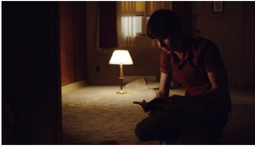
Abb. 25: Bates Motel (Staffel 1, Folge 1): First You Dream, Then You Die (2013), 30. Minute.