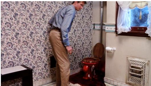
Abb. 18: Richard Franklin: Psycho II (1983), 63. Minute.

... the notion that unwanted matter, unwanted difficulties, unwanted complexities and obstacles will disappear if they're removed from our immediate field of vision. [...] When these discarded problems rise to the surface again ... we react as if a sewer had backed up. We are shocked, disgusted, and angered, and immediately call for the emergency plumber (the special commission, the crash program) to ensure that the problem is once again removed from consciousness. 73