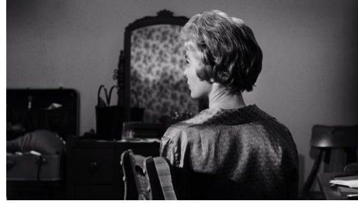
Abb. 9: Alfred Hitchcock: Psycho (1960), 47. Minute

Doch für die Momente der stärksten Einsamkeit, die ein Mensch empfinden kann, nämlich die des Sterbens und des Tötens, reichen Hitchcock die etablierten Bilder nicht mehr. Was Hopper noch nicht konnte, holt der Film nun nach, nämlich den Blick hinter die äußerlichen Oberflächen des Motelzimmers, in den Verdachtsort des Badezimmers, dessen Namen Norman nicht einmal über die Lippen bringt und dafür auf die Hilfe der doch moderneren Marion angewiesen ist (Abb. 10). Dieses wurde von Bates, wohl im Rahmen der berüchtigten wöchentlichen Routinereinigung, bereits vorsorglich mit Handtüchern und in Einwegverpackung verhüllter Kernseife ausgestattet und der Vorhang aus halbtransparentem Kunststoff hält das Bad auch während des sonst so unbeschwertes Duschvergnügens trocken und ungefährlich. Es lässt sich kaum ein modernerer Nicht-Ort denken als der des geschichtslosen, beziehungslosen und identitätslosen immer gleichen Badezimmers.