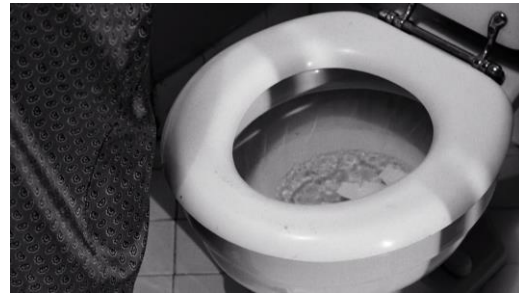
Abb. 11: Alfred Hitchcock: Psycho (1960), 47. Minute.