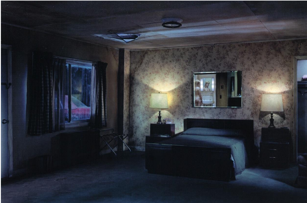
Abb. 24: Gregory Crewdson: Beneath the Roses (2003-2008), Plate 16.