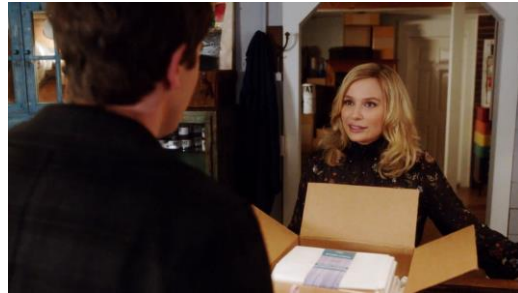
Abb. 29: Bates Motel (Staffel 5, Folge 4), Hidden (2017), 16. Minute.

Was den notwendigen Vorrat an Duschvorhängen betrifft hat Norman unverhofftes Glück, das sich natürlich gegen ihn wenden wird: Im kürzlich eröffneten lokalen Haushaltswarengeschäft (der eigentlich im Zeitalter des Online-Handels ein Nostalgieladen ist) freut sich stets die Inhaberin Madeleine Loomis – die verdächtig nach einer jungen Version von Norma aussieht und zudem den Nachnamen von Marions Liebhaber Sam von 1960 trägt – auf den regelmäßigen sowie verlässlichen Abnehmer von Duschvorhängen („they do not really last to long“, Abb. 29), in dem sie schnell einen Freund für einsame Stunden findet. Während der Nachschub an shower curtains also nicht abreißt, mietet sich Sam Loomis – Madeleines viel reisender erfolgreicher Ehemann – mit seiner Affäre im Bates Motel unter dem Decknamen „David Davidson“ ein (Norman rechnet die ganze Nacht zum nicht rabattierten Tarif ab, obwohl die beiden natürlich nur einige Stunden bleiben möchten). Die Geliebte, Marion (verkörpert von R&B-Sängerin Rihanna), weiß nichts von der Ehe und tritt in die selbe trap wie ihre Vorgängerin vor einem halben Jahrhundert: Mit einem Koffer voller Geld landet sie in einer verregneten Nacht im Bates Motel , um sich dort mit Sam zu treffen und mit ihm eine neue glückliche Zweisamkeit zu beginnen.