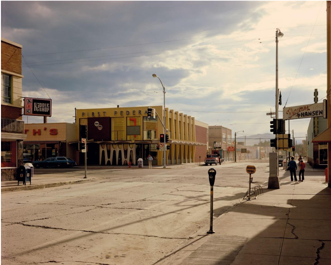
Abb. 1: Stephen Shore: Uncommon Places: Second Street East and South Main Street, Kalispell, Montana, August 22, 1974

Die Metropolisierung der Vereinigten Staaten führte schnell zu einer Abwertung der small towns , weil es ihnen nun scheinbar an allem mangelte, worauf es im sich modernisierenden Amerika ankommt und was in den Städten zu erhoffen war: Lohnbeschäftigung, Ordnung durch öffentlich durchsetzbares Recht sowie individualistisch verstandene Freiheit. 29 Dabei waren die Städte selbst längst zu überannten, demoralisierten und unregierbaren Orten geworden, in denen die ganze Wucht der modernen Einsamkeit wartet. Erholung von der Beschränktheit des small towns , der Tristesse der suburbs und der gesichtslosen Hektik der cities versprachen nun die motels , die am Rande der Fernverkehrsstraßen auf jene warteten, die ihre Fahrtauglichkeit wiederherstellen mussten.