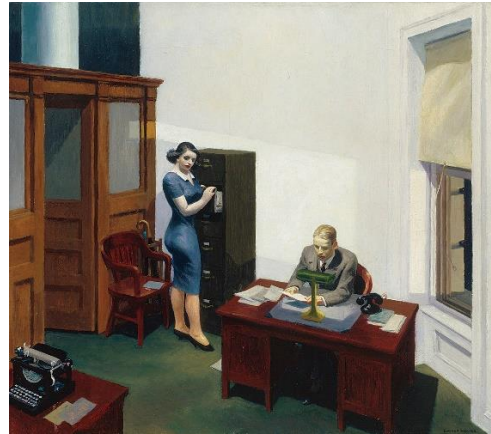
Abb. 3: Edward Hopper: Office at Night (1940)

Doch das ist nur äußerlich. Der Kern der bildgewaltigen Einsamkeiten liegt, gehen wir vom Vorangegangenen aus, vielmehr in der starken Modernität der Arbeiten Hoppers – nicht nur stilistisch, sondern vor allem in Bezug auf die Szenerien, die Requisiten und Kulissen: Seine Figuren wirken nicht vorrangig durch ihre vereinzelter Darstellung – die etwa in der impressionistischen Darstellung der mit flanierendem Blick in einem Pariser Café sitzenden Großstädter eher angenehm romantisch wirken würde –, sondern durch ihre Konfrontation mit den Einrichtungen der Moderne, zwischen denen sie ihr Leben bewerkstelligen müssen.