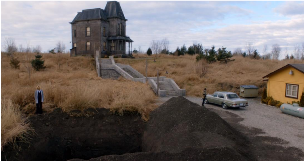
Abb. 27: Bates Motel (Staffel 3, Folge 8): The Pit (2015), 18. Minute.

Am stärksten bleibt BATES MOTEL, wenn es sich auf die etablierte Ikonografie der Langspielfilme zurückbesinnt und die ganze Einsamkeit des Duschraums auskostet. Nach 39 Folgen unermüdlichen aber doch hoffnungslosen Kampfes gegen den Nihilismus der Hochmoderne bleibt Norman Bates nur ein Weg: seine Mutter und sich selbst zu töten. Norma stirbt tatsächlich, doch Norman überlebt hingegen – zu seinem Übel, denn nun kann er nicht mehr auf die mangelhafte, aber doch Halt gebende Gemeinschaft mit Mutter setzen, und verliert sich zunächst in den größten Tiefen der Einsamkeit. Der Körper wird also wie erwartet und erhofft ausgegraben, präpariert und dient im Keller als bizarrer Altar der Erinnerung an geteilte Zeiten, während der Motel-Betrieb weitergehen muss und nach außen der Anschein des trauernden Alleinseins gewahrt wird, obwohl Norman immer wieder von idyllischen Wahnvorstellungen einer unberührten Familiengemeinschaft im Haus der Mutter heimgesucht wird.