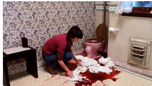
Abb. 19: Richard Franklin: Psycho II (1983), 64. Minute.

Genau das jedoch funktioniert hier nun nicht mehr: Die Kultureinrichtungen der Moderne sind außer Rand und Band, geben ihre verdächtigen Zwischenräume frei und bringen dabei das ganze Ausmaß der Einsamkeit an den Tag, das sonst unter den strahlenden Oberflächen der Wohnhäuser, Bürogebäude und Gasthäuser wie der Autos, Straßen und Swimmingpools versteckt waren. Doch genau diese Aufrichtigkeit der Bildwelt von PSYCHO , der Mut , der ganzen Wucht der modernen