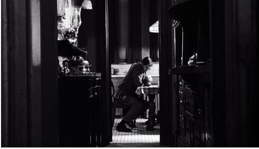
Abb. 8: Alfred Hitchcock: Psycho (1960), 46. Minute.