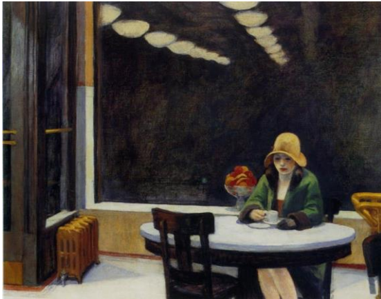
Abb. 2: Edward Hopper: Automat (1927)

In Hopper's paintings there is a lot of waiting going on. Hopper's people seem to have nothing to do. They are like characters whose parts have deserted them and now, trapped in the space of their waiting, must keep themselves company, with no clear place to go, no future. 62