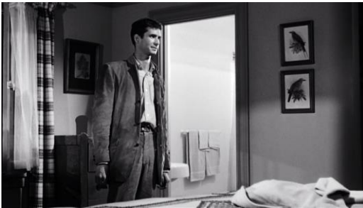
Abb. 10: Alfred Hitchcock: Psycho (1960), 31. Minute.

Doch für die Momente der stärksten Einsamkeit, die ein Mensch empfinden kann, nämlich die des Sterbens und des Tötens, reichen Hitchcock die etablierten Bilder nicht mehr. Was Hopper noch nicht konnte, holt der Film nun nach, nämlich den Blick hinter die äußerlichen Oberflächen des Motelzimmers, in den Verdachtsort des Badezimmers, dessen Namen Norman nicht einmal über die Lippen bringt und dafür auf die Hilfe der doch moderneren Marion angewiesen ist (Abb. 10). Dieses wurde von Bates, wohl im Rahmen der berüchtigten wöchentlichen Routinereinigung, bereits vorsorglich mit Handtüchern und in Einwegverpackung verhüllter Kernseife ausgestattet und der Vorhang aus halbtransparentem Kunststoff hält das Bad auch während des sonst so unbeschwertes Duschvergnügens trocken und ungefährlich. Es lässt sich kaum ein modernerer Nicht-Ort denken als der des geschichtslosen, beziehungslosen und identitätslosen immer gleichen Badezimmers.