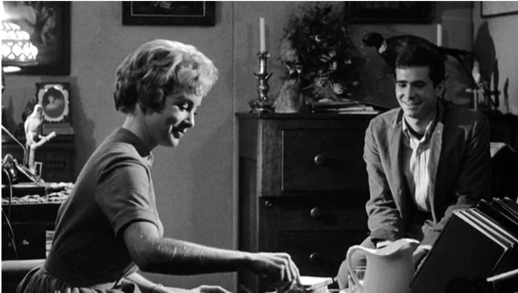
Abb. 7: Alfred Hitchcock: Psycho (1960), 36. Minute.

Für diese narrative Einsamkeit im Bates Motel findet Hitchcock unmissverständliche Bilder: Norman allein in der Küche sitzend und mit dem Gewissen kämpfend, „unmoralische“ Gedanken gehabt zu haben (anscheinend kurz vor seinem notwendigen Moment der Verwandlung in mother , Abb. 8), und Marion in ihrem Motelzimmer, voll darauf konzentriert, wie sie möglichst schadensfrei in ihre imperfekte, aber zumindest komfortable Existenz als Angestellte zurückkehren kann (Abb. 9). Wie Norman und Marion so dasitzen, könnten sie auch direkt einer Hopperschen Inszenierung entsprungen sein, er umgeben von der Leere des House by the Railroad (1925, Abb. 5), das seit der Ankunft der Eisenbahngleise seinen ursprünglichen vormodernen Glanz verloren und gegen ein einsames Dasein in der Abgeschiedenheit eingetauscht hat, und sie – im leichten Mantel für die Dusche vorbereitet – wie die sich zum Fenster wendende Dame auf dem Sofa von Hotel Window (1955), die geduldig ausharrt, bis sich ihre unausweichliche Reise fortsetzt. Nicht also der Gewaltakt oder die sexuellen Andeutungen als solche machen PSYCHO zu einem Standardwerk der Moderne, sondern dass er einen visuellen Wendepunkt markiert hin zu einer skeptischeren Filmkunst, die sich der strukturellen Einsamkeit ihrer Epoche bewusst geworden ist und sich ihr zuwendet. Thomson schreibt: