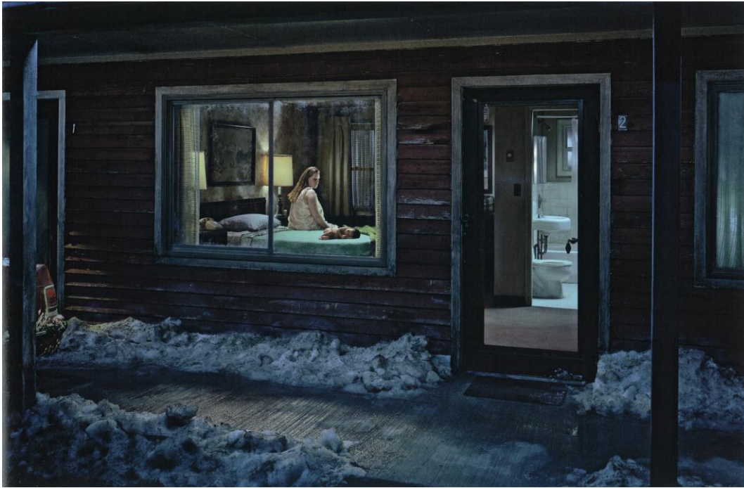
Abb. 22: Gregory Crewdson: Beneath the Roses (2003-2008), Plate 14.