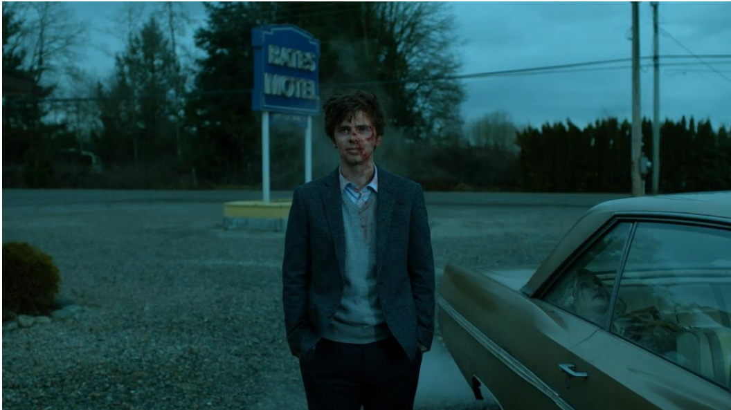
Abb. 34: Bates Motel (Staffel 5, Folge 10): The Cord (2017), 18. Minute.

allgegenwärtigen und dennoch schwer greifbaren Einsamkeitsproblematik nähern sollte. So bleibt es eine dringende Aufgabe nicht nur der Medienwissenschaften, sich an diese gegenwärtigste aller Fragen heranzutrauen, um so gemeinsam eine Vorstellung davon zu bekommen, was uns während und nach Nietzsches zweihundertjährigem Zeitalter der Einsamkeit noch bevorstehen könnte.