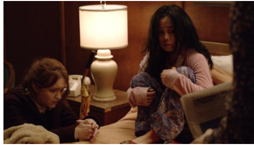
Abb. 26: Bates Motel (Staffel 1, Folge 5): Ocean View (2013), 42. Minute.