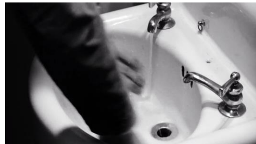
Abb. 13: Alfred Hitchcock: Psycho (1960), 54. Minute.