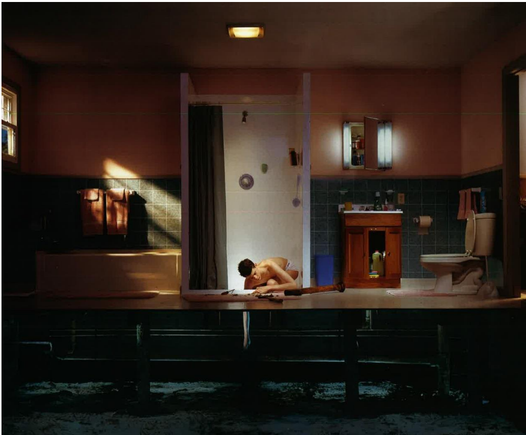
Abb. 23: Gregory Crewdson: Twilight (2002), Plate 14.