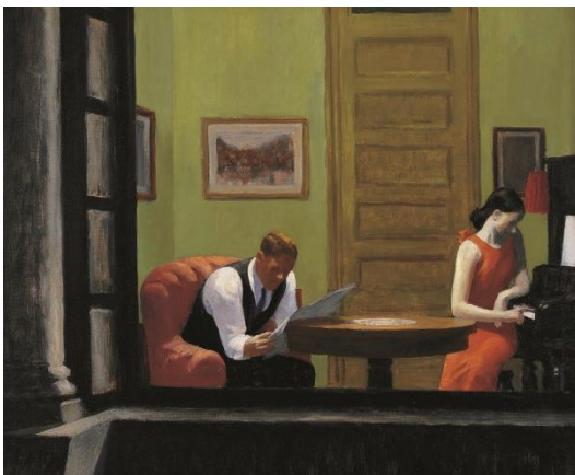
Abb. 4: Edward Hopper: Room in New York (1932)

Sogar (oder vor allem) in den Motiven, in denen wir durch das Fenster mehrere Figuren in räumlicher Nähe zueinander sehen, ist die Einsamkeit im Raum stets mit anwesend, etwa in Room in New York (1932, Abb. 4), das – so beschäftigt wie die Figuren mit sich selbst, ihren eigenen Wünschen und Ängsten zu sein scheinen – auch ein „Room in Phoenix“ sein könnte, der 1960 in der Exposition von PSYCHO erscheint und nicht zufällig ebenso von außen durch ein Fenster in den Blick genommen wird.