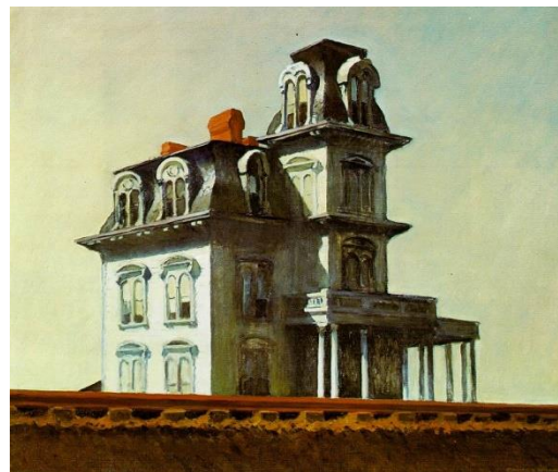
Abb. 5: Edward Hopper: House by the Railroad (1925)