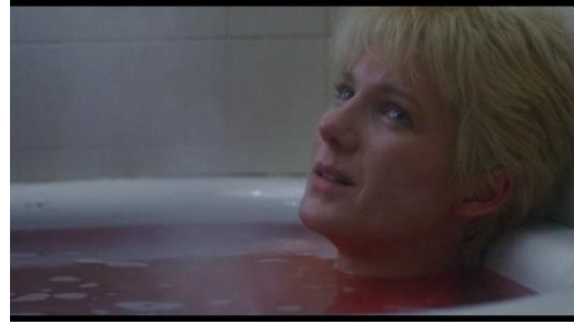
Abb. 21: Anthony Perkins: Psycho III (1986), 33. Minute.