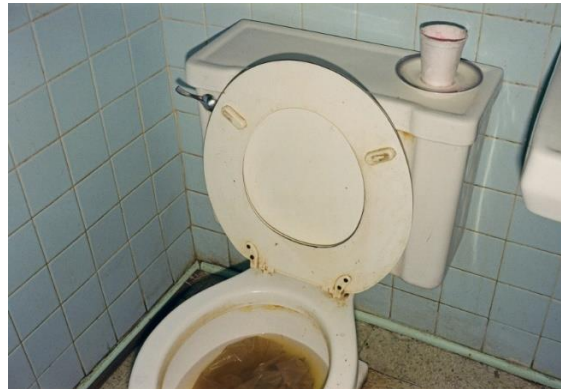
Abb. 17: Stephen Shore: American Surfaces: N.M. 44, New Mexico June 1972.

Auch in PSYCHO II (Richard Franklin, USA 1983), einem weniger bekannten aber höchst aufschlussreichen Fortsetzungsfilm des Klassikers von 1960 mit einem sichtlich gereiften Anthony Perkins in der erneuten Rolle des Norman Bates, der nach zwei Jahrzehnten in einer Nervenheilanstalt für Kriminelle in sein Motel zurückkehrt, geht es genau um diese Momente, wenn sich die Moderne die Blöße gibt. Die Zeit hat ihre Spuren an den Fassaden des Motels hinterlassen, und der eingesetzte Manager hat das einst stolze Familien-Gasthaus in ein zwielichtiges Stunden-Etablissement umgewandelt. Tatsächlich ist Norman in der Zeit viel ruhiger geworden, spielt friedlich auf dem Klavier die Mondscheinsonate, während sich in seinem Badezimmer eine attraktive Bekannte duscht und spürt anscheinend kein unmittelbares Verlangen mehr danach, sich von Zeit zu Zeit in mother zu verwandeln. Jedoch holt die Vergangenheit den älter gewordenen Norman Bates ein. Während um ihn herum rachsüchtige Angehörige der einstigen Opfer eine perfide Intrige planen, um Bates wieder zum Morden zu provozieren, spielen