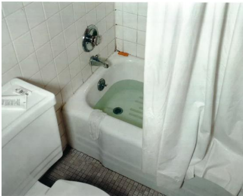
Abb. 16: Stephen Shore: Uncommon Places: Room 115, Holiday Inn, Belle Glade, Florida, November 14, 1977.

Für diese Augenblicke unverhoffter Momente der „Ehrlichkeit“, in denen es „menschelt“, interessiert sich auch Stephen Shore. Wäre bei Hopper ein solcher Blick hinter die kalten Fassaden seiner Szenerien undenkbar, erscheinen nun die Alltagsdinge der Moderne in ihrer ganzen abscheulichen Aufrichtigkeit: Schon beim Blick in einen vollkommen verdreckten Kühlschrank steigt uns der Gestank einer seit zwei Monaten nicht mehr fachmännisch gereinigten Gemeinschaftsküche entgegen, zwischen den Fliesen einer Badewanne im „Holiday Inn“ arbeitet sich schon allmählich schwarzer Schimmel in den Fugen hinauf (Abb. 16), und eine der chronisch verstopften US-amerikanischen WCs hat wieder den Geist aufgegeben und gibt den Blick frei auf all die Dinge, die sonst eigentlich ganz schnell per Spülung verschwinden sollen (Abb. 17).