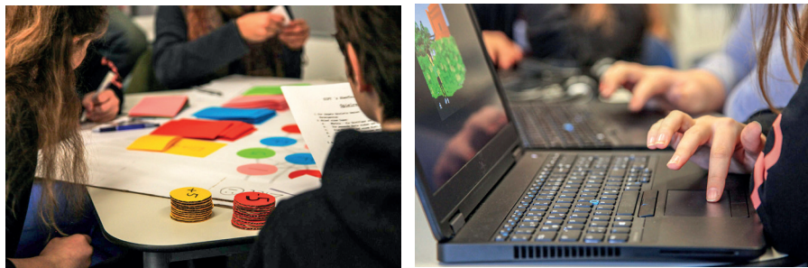
Abbildungen 2 und 3: Testen der Spielprototypen mit den Schülerinnen

In einer darauffolgenden Überarbeitungsphase hatten die Studierenden somit die Möglichkeit, die Konzepte ihrer Spiele zu schärfen, um diese in einem abschließenden Plenum mit Hilfe eines Posters zu präsentieren.