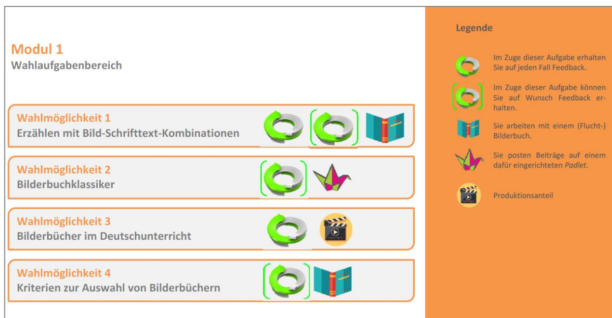
Abb. 2: Übersicht der Auswahlmöglichkeiten im Wahlaufgabenbereich des Moduls 1

Durch die Wahlaufgaben war es den Studierenden möglich, individuelle Wege durch das neue Lerngebiet zu beschreiten. Die Entscheidung für eine der Wahlaufgaben sollte dabei stets in Rekurrenz auf das persönliche, im Zuge der Einführungssitzung gesteckte Entwicklungsziel erfolgen. Für die eher am Ausbau der eigenen Textanalysekompetenz interessierten Studierenden war in Modul 1 die erste Aufgabe „Erzählen mit Bild-Schrifttext-Kombinationen“ besonders geeignet, während die eher an den didaktischen Fragestellungen orientierten Studierenden z.B. Aufgabe 3 „Bilderbücher im Deutschunterricht“ wählen konnten.